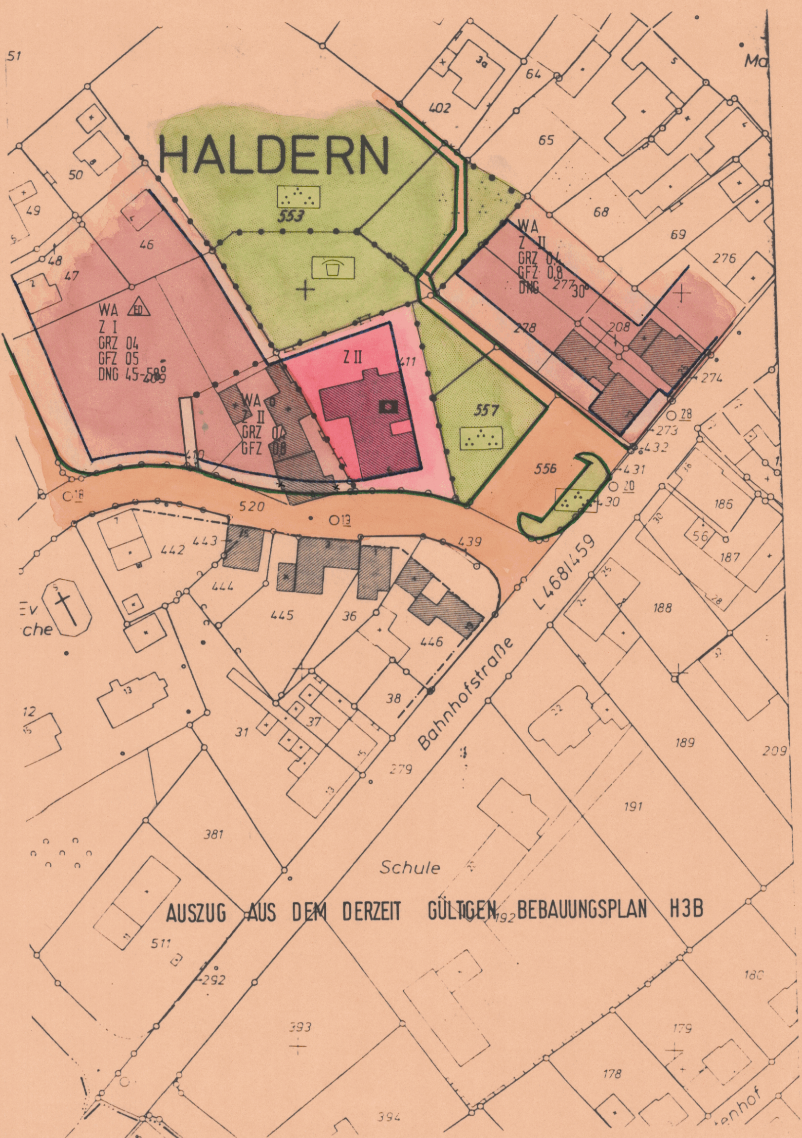
AUSZUG AUS DEM DERZEIT GÜLTIGEN BEBAUUNGSPLAN H3B